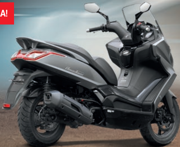
NEW DOWNTOWN 125i ABS ve stříbrné